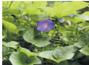
Dondiego de día (maravilla)

Hay un grupo grande y diverso de plantas venenosas, las cuales pueden causar una variedad de síntomas. Llame al Centro de Envenenamiento para información.