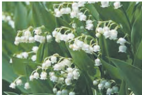
lirio de los valles

Algunas plantas podrían tener aceites o partes espinosas que causan una irritación de la piel. La irritación puede ser leve hasta severa.